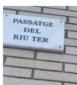
Sortint de casa

Per a arribar a la sortida de la ruta a Setcases, al Pirineu ripollès, vam agafar el tren de bon matí fins a Sants, després fins a Ripoll, i posteriorment un bus de Ripoll a Setcases.