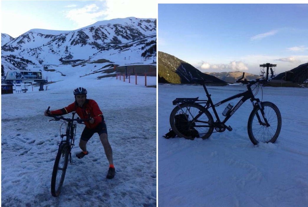
Pistes de Vallter 2000