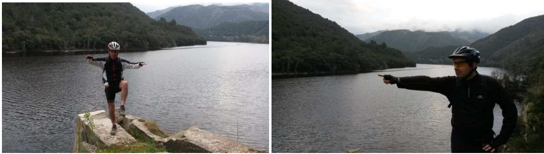
Guaita! Un paiu ballant sardanes!