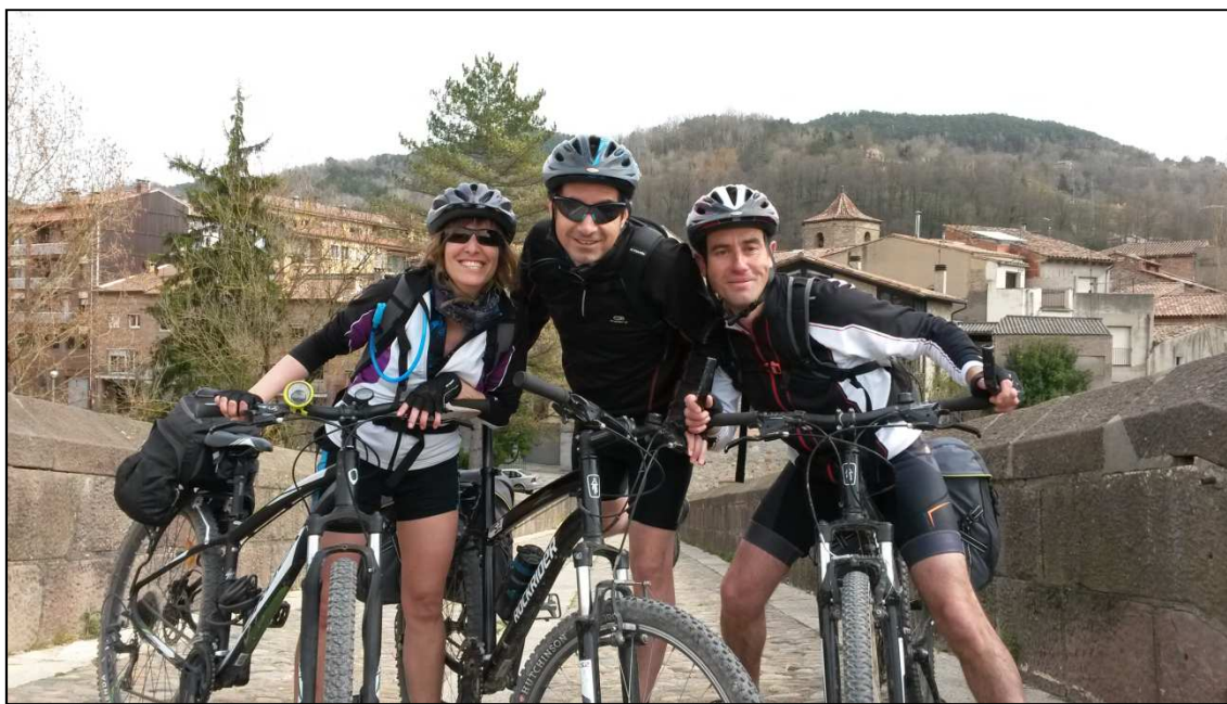
Els Gaterus Btterus a la Ruta del Ter