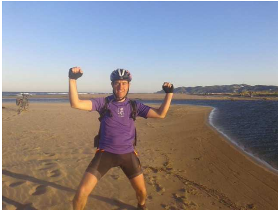
"Moti" a la Gola del Ter.

Mentre ens dutxàvem el Moti ja era a la Gola del Ter enviant fotos. Ho havia aconseguit! El Ter del naixement a la desembocadura, d'Ulldeter a la Gola del Ter!!! Siiiiiiiiiii! (amb entonació cristianoronaldesa).