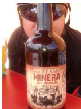
Vigila! Tens una mosca a la cervesa!