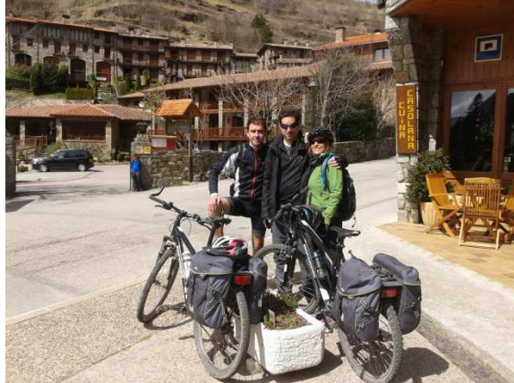
Arribada a Setcases

Però bé! Això rai! Aviat va sortir el tema "Vi". Volem un vi català!. I ens porten el que tenen. Un Carinyena. Bé, un Carinyena que no queda clar si és de Carinyena (Aragó), és varietat carinyena (cep negre), és català,