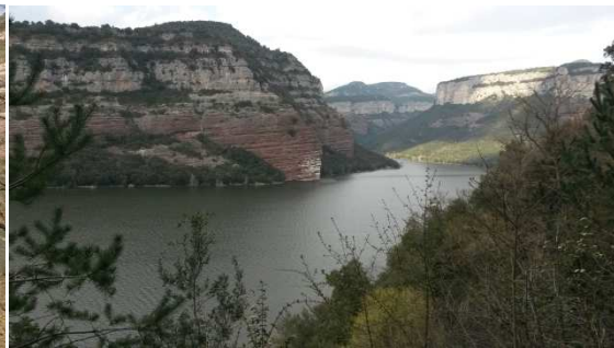
Pantà de Sau.

A partir d’aquí una pista preciosa va vorejant el pantà i va oferint infinitat de paisatges extraordinaris amb l’aigua a primer terme i els espectaculars cingles de Tavertet al darrera.