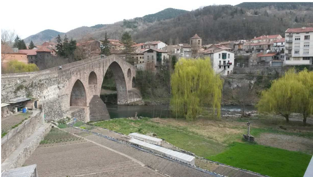
Sant Joan de les Abadesses

Les pistes eren molt xules però s'avançava molt més a poc a poc. Finalment arribarem a Sant Joan de les Abadesses, poble ja conegut pels Gaterus Btterus per haver-hi passat dues vegades en la ruta del carrilet.