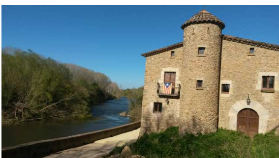
Molí. Molt a prop de Sant Llorenç de les Arenes.

La Ruta indicava que hi havia un tram alternatiu en aquesta zona, i el volíem agafar per baixar