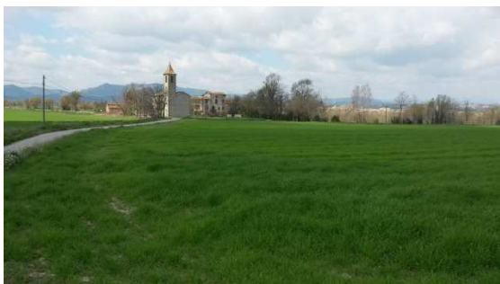
Sant Miquel de la Guàrdia. Les Masies de Roda.

Entre les senyals del camí i les indicacions del Sr. de Torelló, que deien que havíem d'anar a La Gleva, finalment ens en vàrem sortir... i si, vàrem arribar al Santuari de la Gleva. La Gleva és un municipi que forma part de les Masies de Voltregà que està molt a prop, i és conegut principalment pel seu santuari a tocar del Ter.