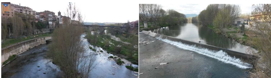
El Ter a Roda de Ter

Poc després a Roda de Ter un impressionant pont sobre el riu ens ofería unes vistes espectaculars. Aquest punt era l'inici de la "pujada", segons el perfil de la ruta. Vàrem decidir fer una part important de la pujada abans de dinar, i aturar-nos a dinar a Tavèrnoles ja a prop de la zona dels pantans.