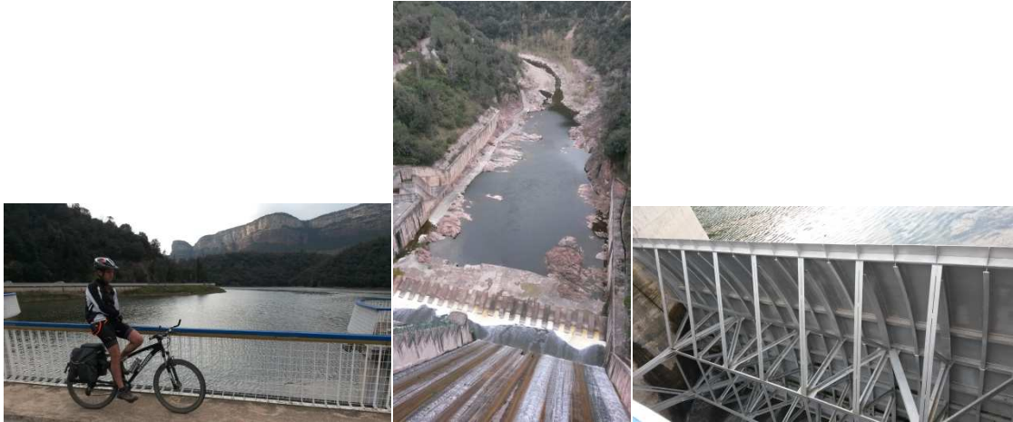
Presa del pantà de Sau

Passàrem per la presa de Sau i vam descendir cap al pantà de Susqueda que és a tocar del de Sau. Allí també una pista magnífica anava vorejant el pantà amb vistes igualment fabuloses dels meandres del pantà. La pista anava vorejant, relativament plana, però el pantà resultà molt llarg, no s'acabava mai. Ja començava a faltar la llum i vàrem haver d'engegar els frontals. La veritat és que es va fer llarg fins que finalment vam arribar a la presa de Susqueda, ja de negre nit.