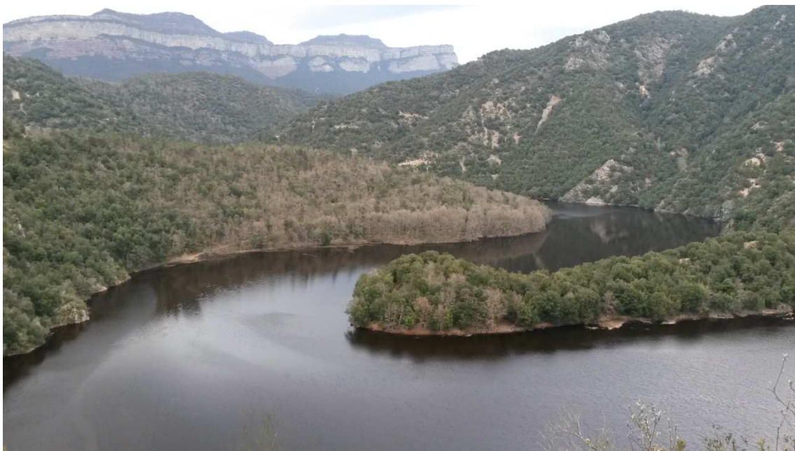
Pantà de Susqueda

Passàrem per la presa de Sau i vam descendir cap al pantà de Susqueda que és a tocar del de Sau. Allí també una pista magnífica anava vorejant el pantà amb vistes igualment fabuloses dels meandres del pantà. La pista anava vorejant, relativament plana, però el pantà resultà molt llarg, no s'acabava mai. Ja començava a faltar la llum i vàrem haver d'engegar els frontals. La veritat és que es va fer llarg fins que finalment vam arribar a la presa de Susqueda, ja de negre nit.