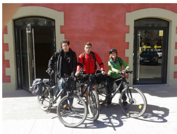
Estació de ffc de Ripoll

A Ripoll s'havia d'agafar el bus, i això sempre és una gran incertesa per les bicis. Si les deixaran pujar, si les faran desmuntar, les faran embalar... ens havien assegurat que no hi havia cap problema. Però així que li diem al conductor que anem amb tres bicis, ens