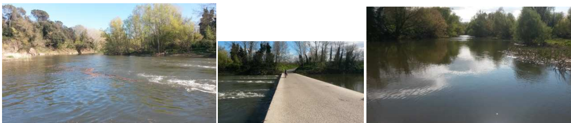
Passallís de Sobrànigues. Sant Jordi Desvalls.

Vam passar pel bonic passallís de Sobrànigues (ep! Que consti que aquest nom preciós i ressonant no me l'he inventat) i ja érem a Flaça, final de l'etapa del darrer dia de la ruta, i territori ja explorat pels Gaterus Btterus.