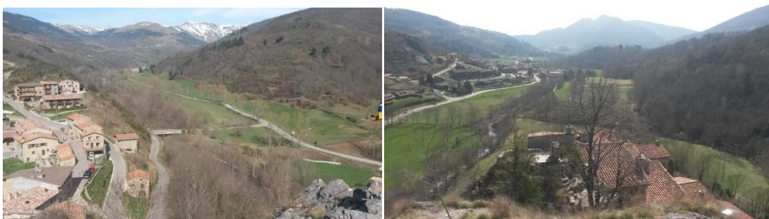
Vistes des de la Roca: La Roca i el Pirineu al fons. I per l'altre banda Llanars al fons.

Passem Vilallonga de Ter i aviat arribem a un indret, en el qual, quan vàrem pujar amb l'autobús ja ens hi vam fixar. Un poblet molt petit dalt d'una muntanya en un penya-segat. La raresa i bellesa de l'indret no dóna lloc a dubtes, i fem la primera parada i/o desviament de la ruta.