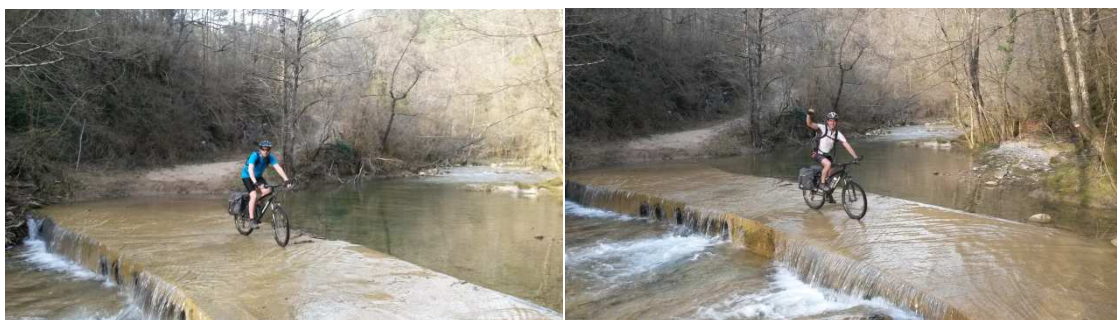
Riera de Vallfogona a Massacs (Ripoll)

Però al cap d’uns quilòmetres la cosa es va anar complicant, la pista continuava sent pista, els paisatges continuaven sent preciosos, però les pendents començaven a ser espectaculars. La pista s’anava endinsant cap a l’interior deixant el Ter bastant lluny, pujant muntanyes i baixant a valls, amb cada cop menys indicacions. A trams hi havia moltes indicacions i en altres totalment inexistent, si bé cal ser just i dir que amb les indicacions i la “lògica” trobaves el camí.