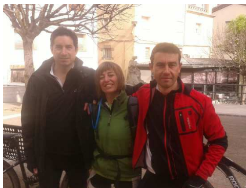
Amer. Monument als musics de la vila

A pocs metres de distància de la fonda, pràcticament per dins del poble, passa la via verda del Carrilet. Enfilàrem cap allà i direcció cap a Girona. Poc després de la sortida vàrem passar pel Pasteral on el dia anterior havíem passat després de patir pedalant durant hores en la foscor més absoluta... com canvien les coses amb la llum del dia!