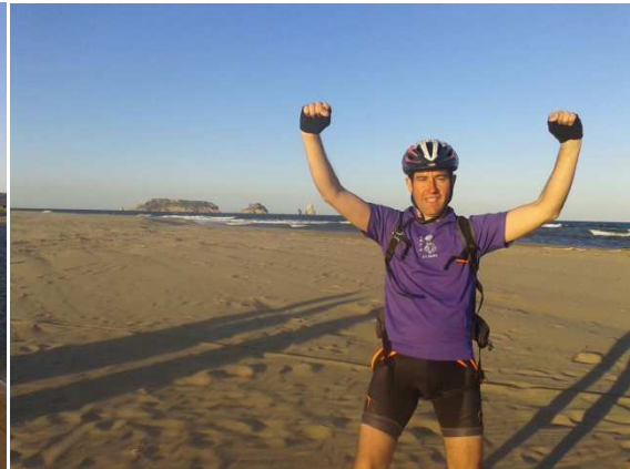
Illes Medes al fons.