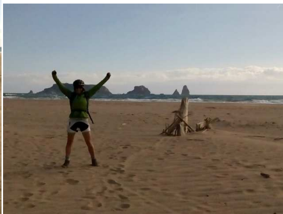
La Sas a la Gola del Ter