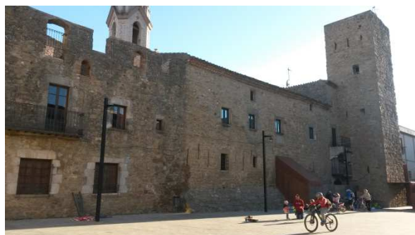
Verges. Plaça major. Torre muralla i campanar al darrera.

Arribem a l'hostal Alberana de Verges, demanem l'habitació i... ens diuen que no tenim reservat. Com? No fotem! Comencen a buscar llibres... a fer trucades... que havíeu demanat? Quan ho havíeu fet? Per internet? Per telèfon?... Anaven amunt i avall, parlant amb un i amb l'altre. Ai, ai, ai! En fi! sigui el que sigui no estava reservat.