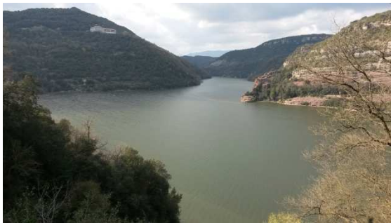
Parador de Sau.

Reprenguérem el camí ara per carretera cap a la zona dels pantans. En aquest trajecte s’escaparen algunes gotes de pluja, però per sort no va anar a més. Aviat arribàrem al pantà de Sau, a la zona del famós parador de Sau on es va redactar l’estatut del 79.