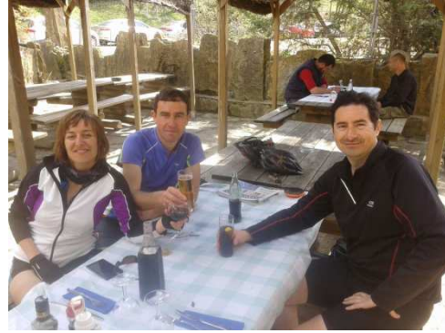
Dinant a Tavèrnoles

Al costat nostre va dinar una altre trio de bterus, amb un motivat al capdavant. Mira! Com nosaltres!. Eren una mica més “màquines” que nosaltres, però vaja, va ser interessant. Sobretot les anècdotes que explicava d’un grup de bterus “bikeres” les quals deia que no entenia com unes ties molt enormes, de cames i culs, l’avançaven en les pujades. Era molt graciós el motivat veí. I dono fe que eren uns màquines. Per la tarda ens van avançar que ni els vam veure passar, jajaja. Com deuen ser les bikeres !?!