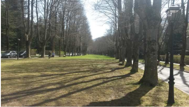
Passeig Maristany. Camprodon.

Vam entrar al poble pel majestuós passeig Maristany que personalment el trobo preciós, amb