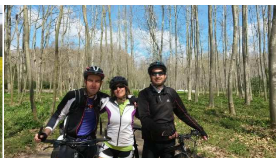
Pla dels Socs, Salt