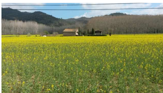
Camp a la zona d'Anglès.

La via verda del Carrilet és un camí plàcid molt ben condicionat i va fent baixada, per tant ciclar per ella és molt còmode i anàvem a bona velocitat. Els pobles van anar passant, i anàvem recordant les parades o anècdotes dels anteriors dos passos per aquesta via.