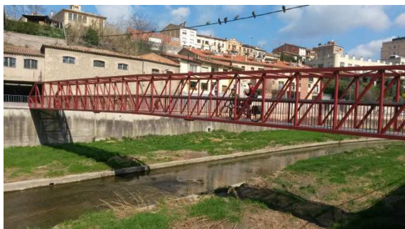
Torelló. Pont sobre el riu Ges

La represa de la ruta va ser una mica caòtica per dins a Torelló, doncs les senyals semblava que